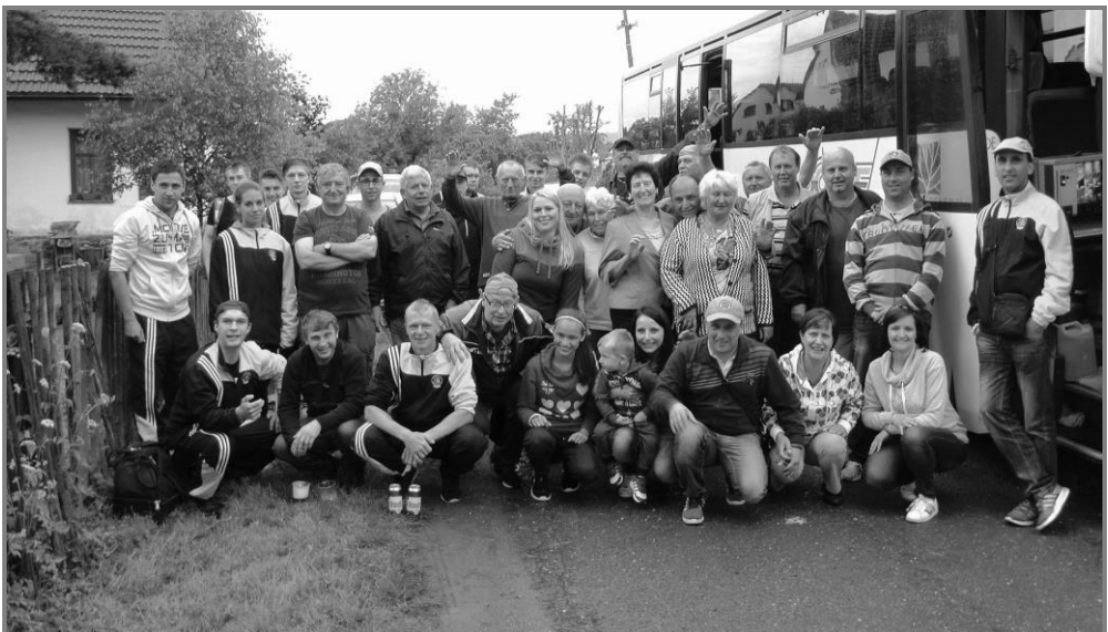
Autobusový zájezd do Mezna

- Hned druhý den jsme se ve spolupráci s městysem podíleli na soutěži Vesnice roku 2016, kde bylo k vidění v našem areálu v 8 hodin ráno okolo 30ti dětí hrajících fotbal a předvádějících požární dovednosti před přítomnou komisí. Děkujeme za vstřícný přístup rodičů jednotlivých dětí při omluvách ve škole a následnou dopravu a jednotlivým vedoucím za to, že si ve všední den zařídili pracovní volno.