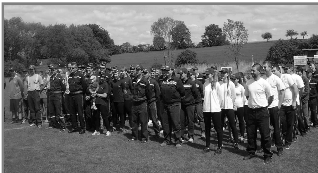
Ze zahájení soutěže - společný nástup všech družstev

Soutěže se tento rok z okrsku Maršovice zúčastnilo 5 týmů v kategorii mužů (Maršovice, Strnadice, Zderadice, Zahrádka, Dlouhá Lhota), 2 družstva žen (Maršovice, Strnadice) a 2 dětské kolektivy (Maršovice, Zahrádka). Pozvání na soutěž přijalo také družstvo mužů z SDH Šebáňovice (patřící do okrsku Vrchotovy Janovice), které soutěž absolvovalo jako host.