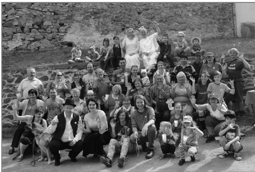
Běh do nebe