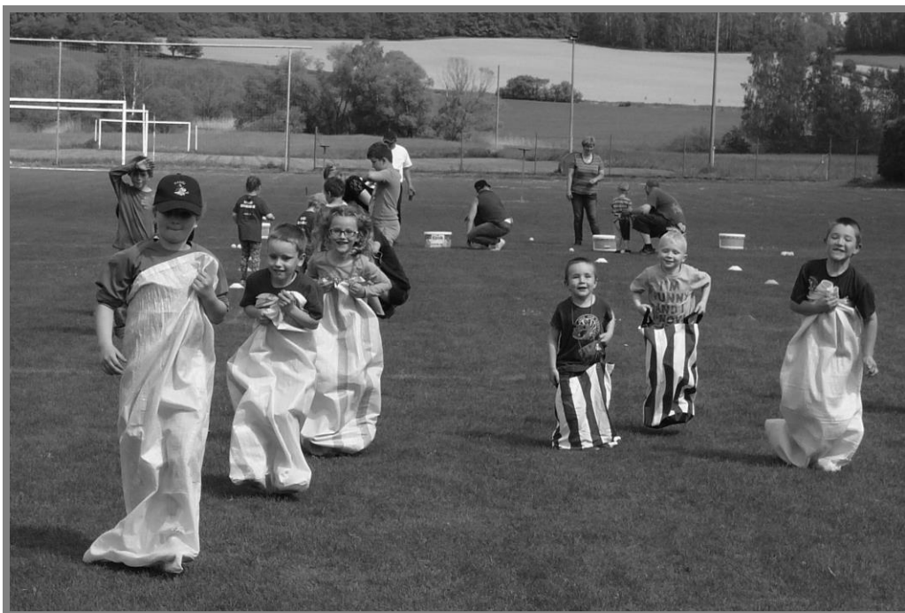
Doprovodný program pro děti

Kolektivy žen a mužů již tradičně absolvovaly 3 disciplíny: pořadovou přípravu, běh jednotlivců na 100 m překážek a požární útoky. Zkompletováním výsledků ze všech 3 disciplín pak vzešlo také konečné pořadí jednotlivých družstev. Dětské kolektivy mezi sebou soutěžily pouze ve 2 disciplínách – pořadové přípravě a požárním útoku.