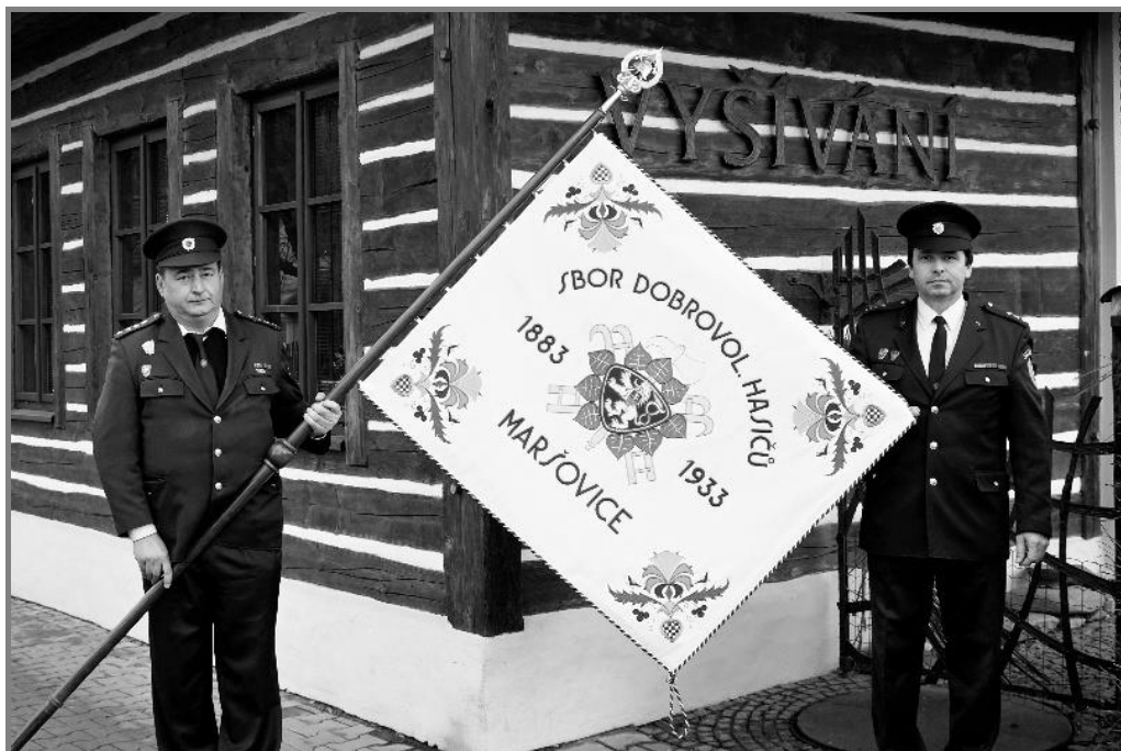
Předání nového praporu v Ústí nad Orlicí

Po delším rozhodování jsme se v roce 2015 rozhodli pro výrobu repliky historického hasičského praporu a stuh. Pochází z roku 1933 a byl věnován sboru tehdejší pražským spolkem rodáků a přátel z Maršovic a okolí. Bylo to u příležitosti 50. výročí trvání hasičského sboru v Maršovcích. Prapor se používal hlavně při slavnostních příležitostech - jak hasičských či obecních oslavách a výročích, ale také při pohřbech členů hasičského sboru. Za ty roky na praporu a stuhách zapracoval zub času a nechtěli jsme do této, dnes již historické památky, amatérsky zasahovat, abychom neudělali ještě větší škody, než jsou nyní. Proto jsme se rozhodli pro jeho opravu a výrobu přesné repliky. Jelikož je výroba náročná a hlavně drahá, rozhodli jsme se oslovit spoluobčany a vyhlásili dobrovolnou sbírku na výrobu nového praporu. Na konci loňského roku byla sbírka ukončena. Zúčastnilo se celkem 45 občanů, především členů a příznivců sboru, za což všem tímto děkuji. Zvláštní poděkování pak patří městyši Maršovice. Celková vybraná částka činila 49 350 Kč. A doplatek k celkové ceně praporu 57 838 Kč doplatil sbor ze své pokladny. Všem občanům, kteří finančně přispěli, děkujeme.