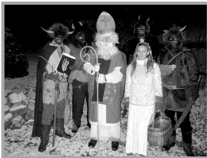
Mikulášská obchůzka v Maršovickách dne 5. 12. 2012