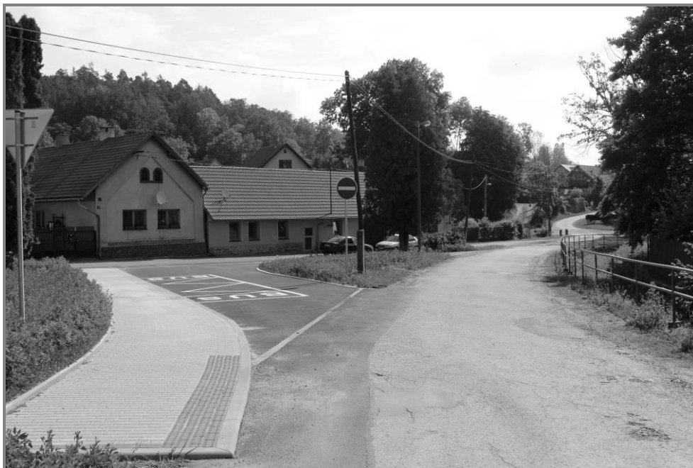
Zderadické autobusové obratiště