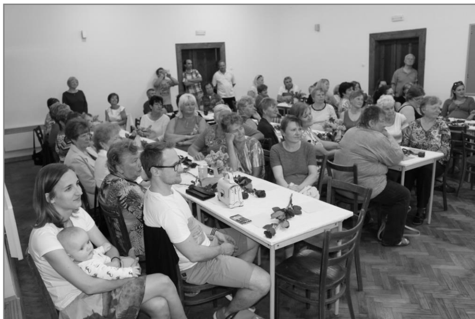
13. května proběhl na sále Na Radnici MARŠOVICKÝ DEN ŽEN s módní přehlídkou