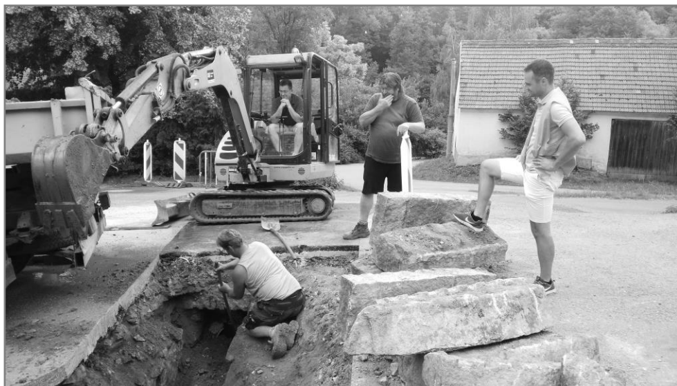
Oprava propustku v Zahrádce

Bližší info na: https://www.dotacedestovka.cz/