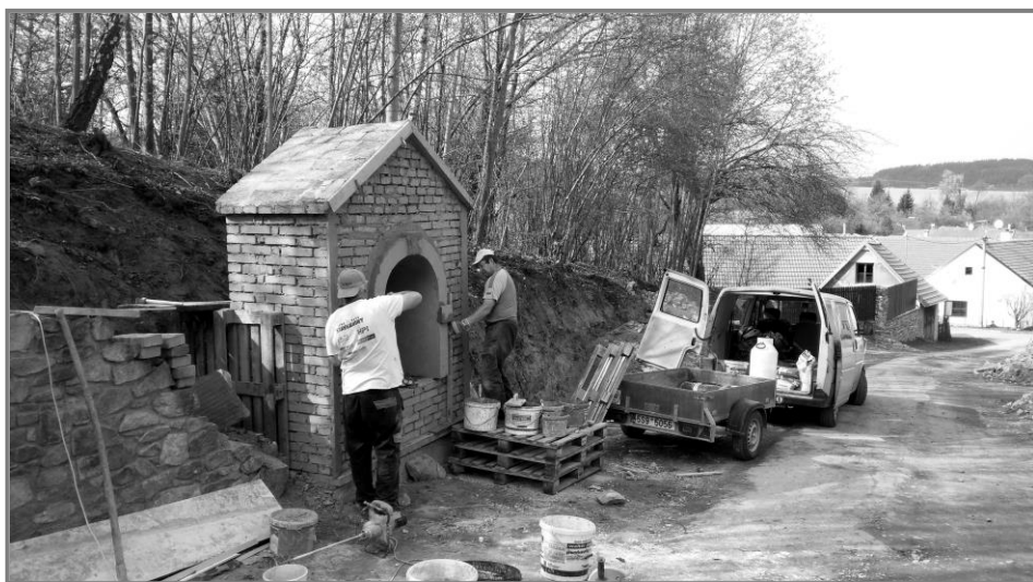
Stavba Svatohubertské kapličky v Maršovicích