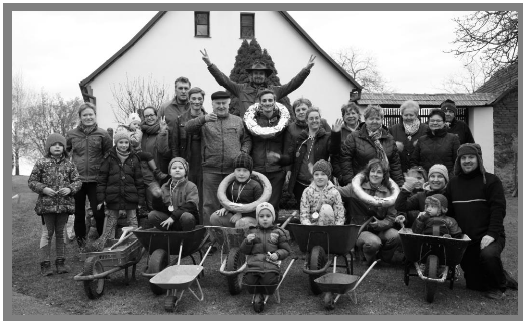
Řehovické kolečko