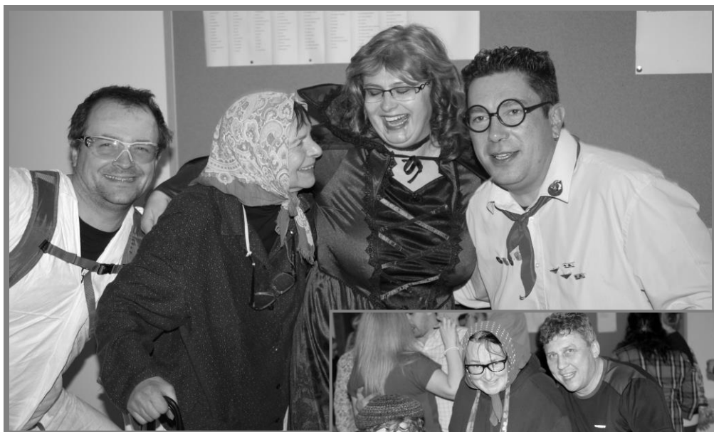
Šibřinky v Maršovicích

a shromažďování se, což mělo za následek přerušení všech aktivit, co se týče kolektivního sportu v obci. Byly přerušeny na dobu neurčitou veškeré fotbalové soutěže na všech úrovních. Momentálně si jen můžeme pomalu začít sčítat rány, které nás čekají v našem rozpočtu při nepořádání soutěžních utkání a akcí na našem hřišti. Všichni pevně věříme, že za chvíli bude vše zase povoleno a Vy, příznivci kopané a sportu tady v Maršovicích budete moct opět navštěvovat náš sportovní areál při zápasech všech mužstev a pořádaných akcí.