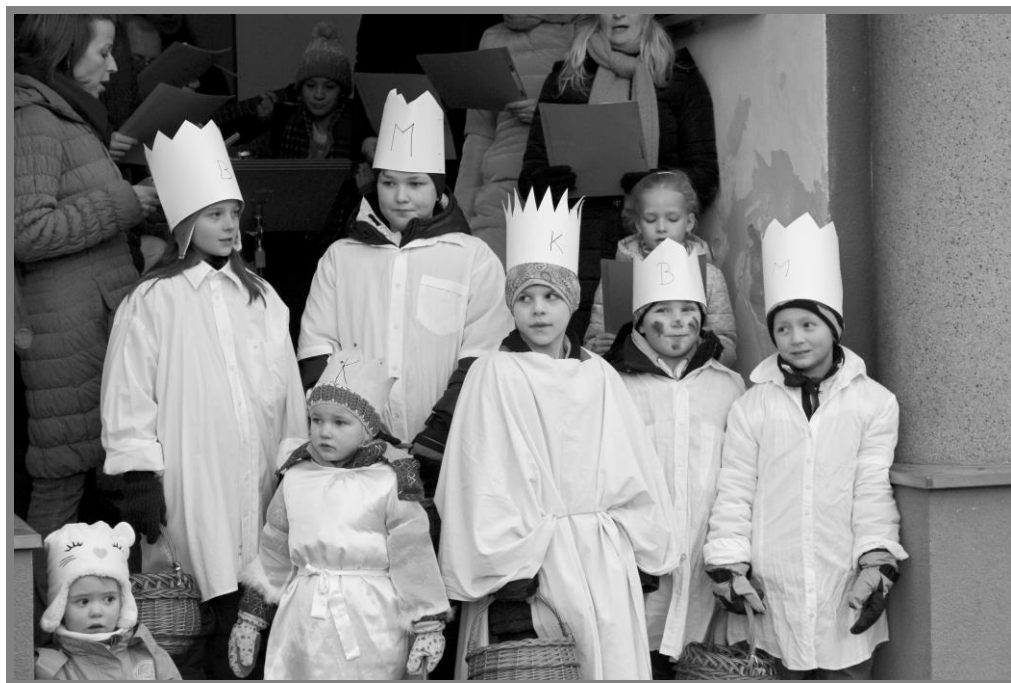
Tříkrálové zpívání v Maršovcích