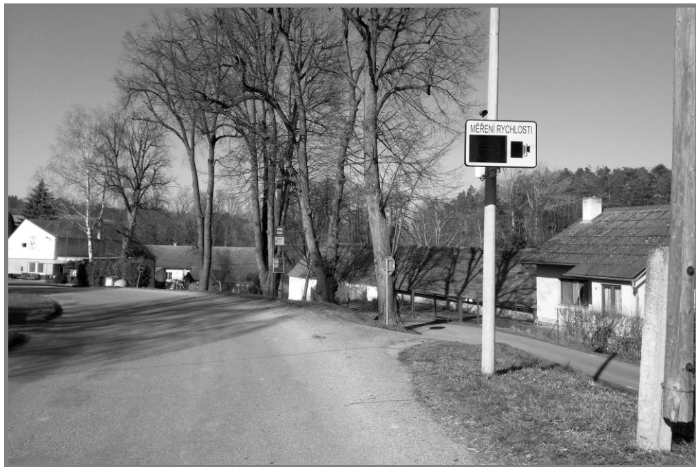
Nově nainstalované měřiče rychlosti v Zahrádce