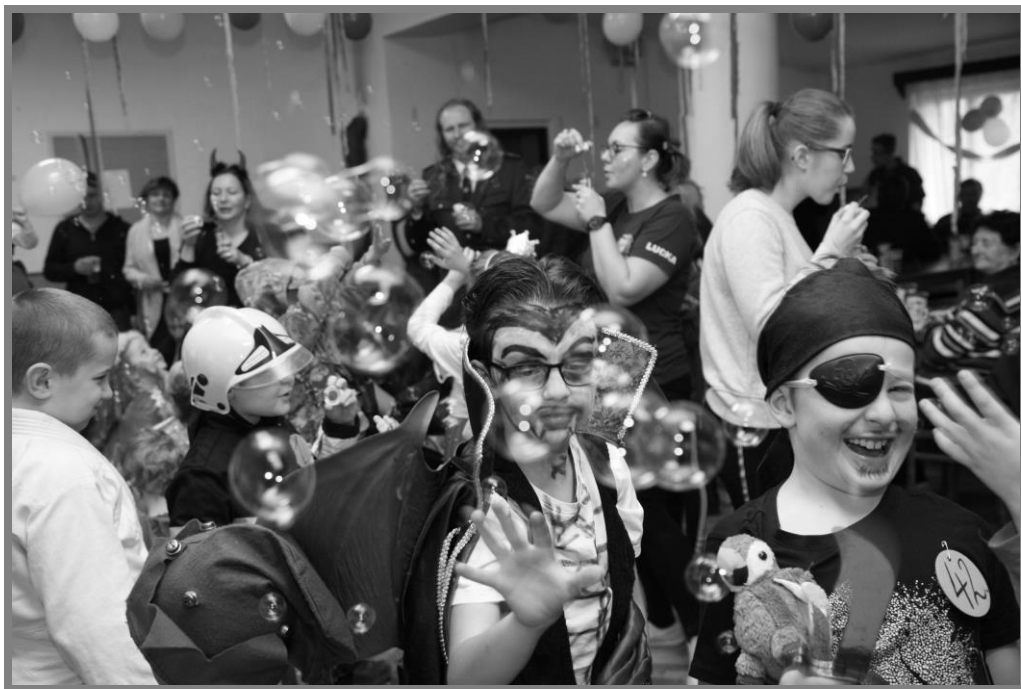
Dětský karneval ve Zderadicích