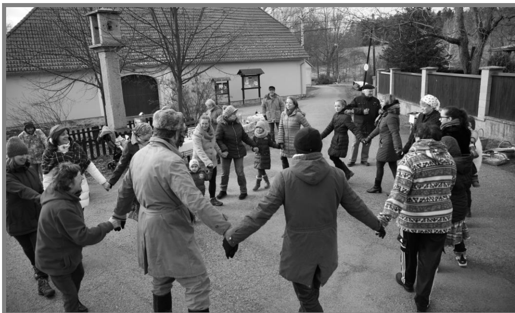
Řehovický jarmark

Třetí ročník směnného řehovického jarmarku lze taktéž považovat za velmi vydařený. Na návsi panovala výborná atmosféra, směňovaly se letos hlavně marmelády a jídlo. Ale když jste byli rychlí, mohli jste směnit i med, svíčky, domácí šťávu či místní sušené chilli papričky a výrobky z nich. O zábavu se také starala hudba na přání či slosovatelná loterie.