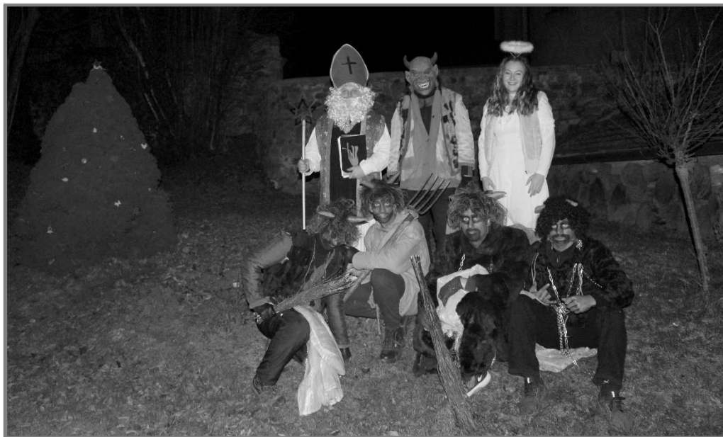
Maršovická Mikulášská obchůzka