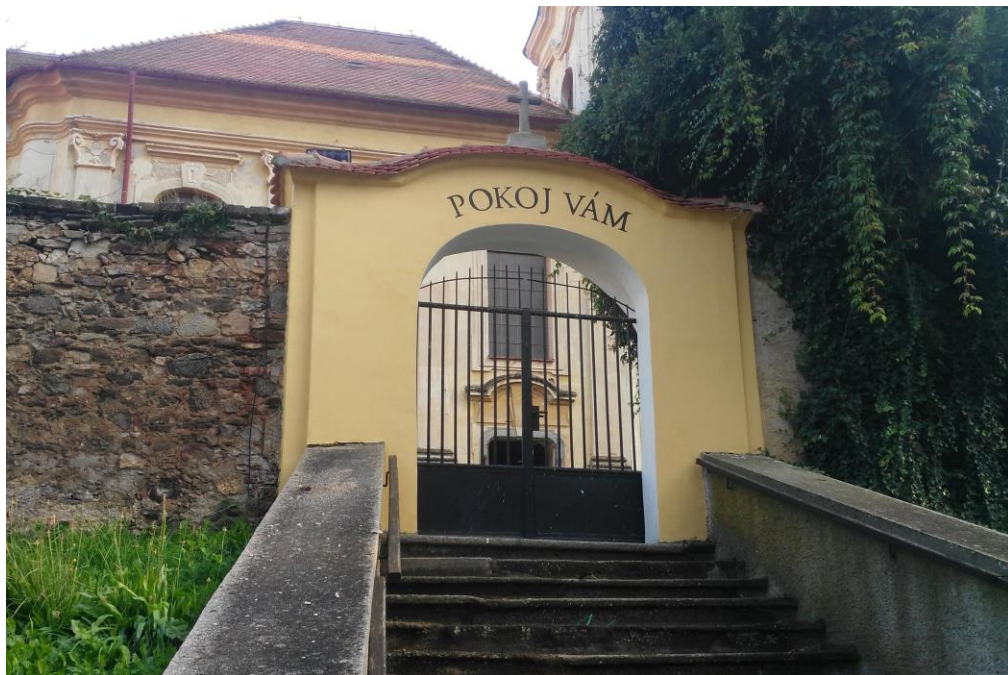
Opravená vstupní brána na hřbitov v Maršovicích