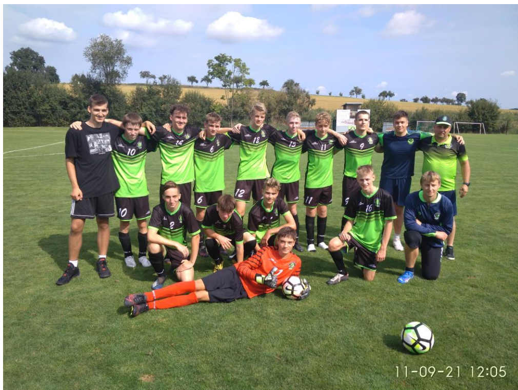
Dorost v nových dresech