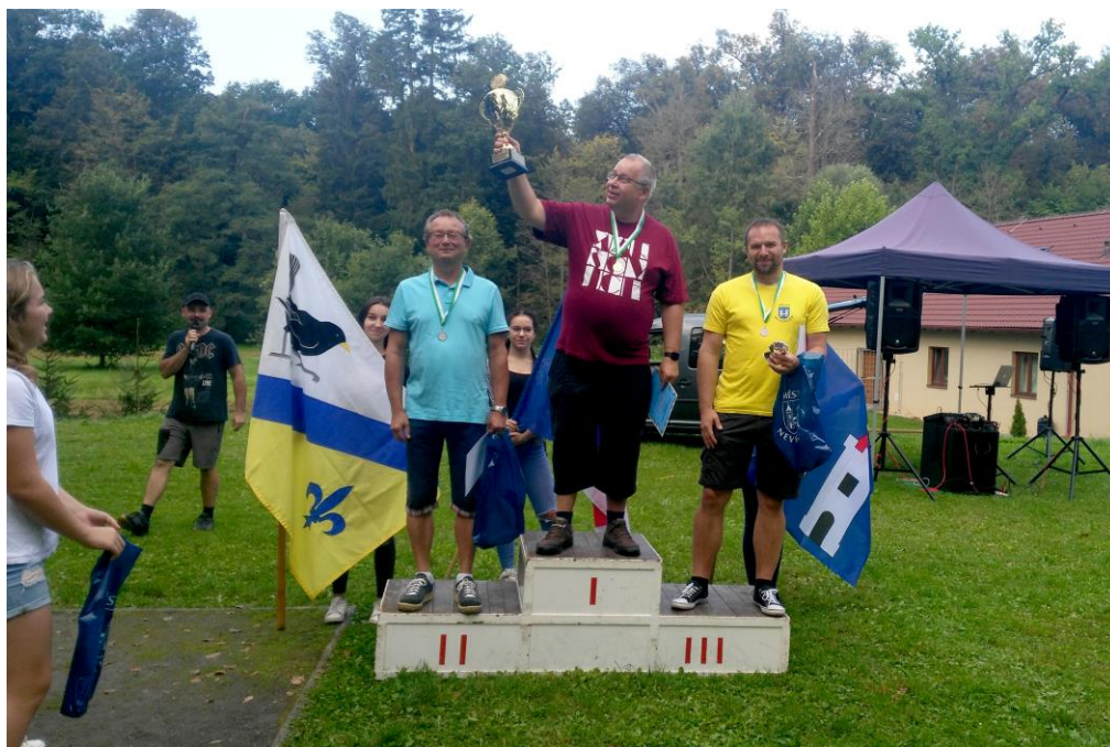
Neveklovské běhy 2021