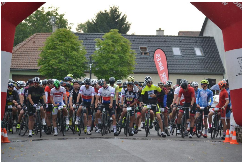
Cyklistický závod Železný dědek 2021