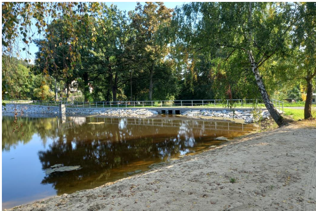
Obnovený rybník ve Mstětících