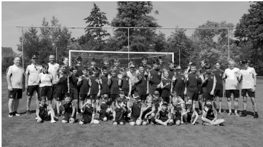
Soustředění mládeže 2021

jsme tak tentokrát mohli uspořádat celé soustředění pro všechny věkové kategorie najednou, a to naše výprava čítala rekordních 53 dětí a dospělých!!