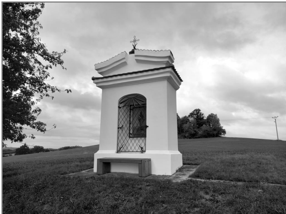
Opravená kaplička sv. Jana Nepomuckého nad Maršovicemi