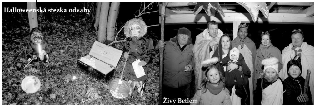
Halloweenská stezka odvahy

Další akcí, kde jsme měli všichni možnost se potkat, byl již druhý ročník Živého Betlému v Řehovicích, během kterého nám dokonce začalo trochu sněžit. Zpívaly se koledy, bavilo a hodovalo se a všichni jsme si užívali skvělou předvánoční atmosféru.