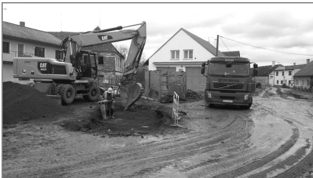
Výstavba kanalizace a ČOV Maršovice