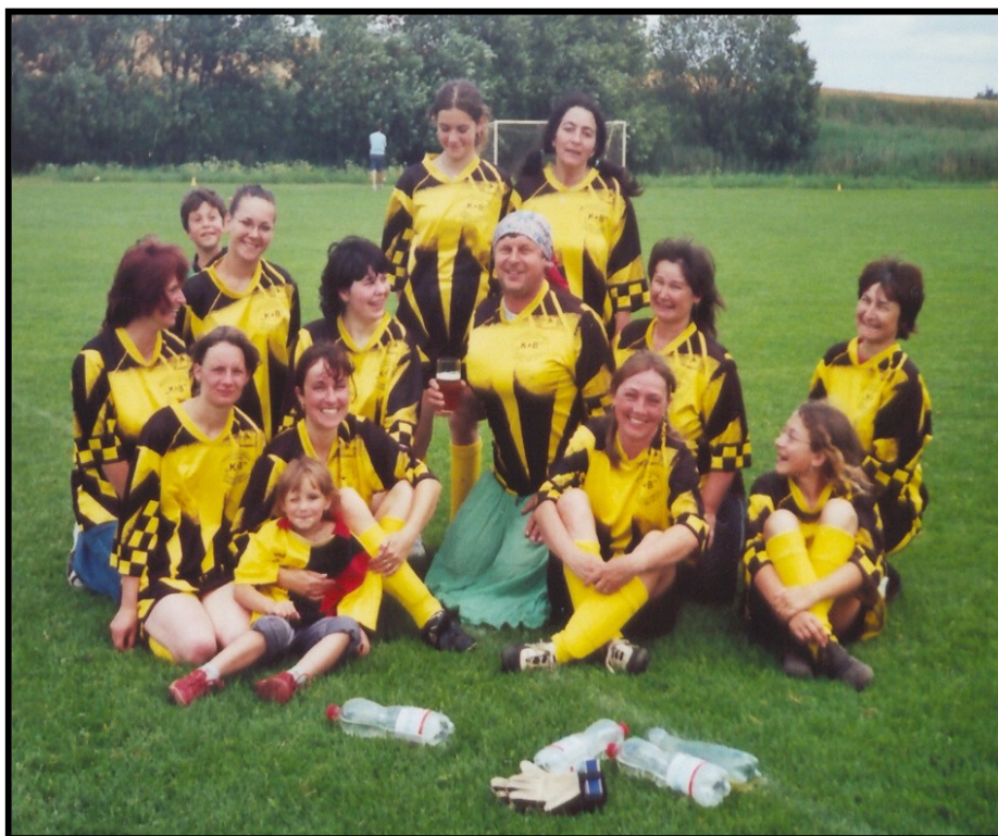
Maminky po tradičním rozlučkovém zápase proti svým dětem na závěr sezóny oddílu maršovické přípravky