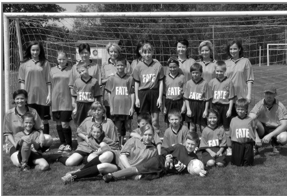
Ze závěrečné přípravy – proti maminkám

„B“ tým. Sezónou 2012/13 procházel omlazený celek, který byl doplněn dorostenci, jejichž mužstvo nemohlo být v loňském létě z důvodu malého počtu hráčů přihlášeno do soutěže, nad očekávání dobře. Příjemně překvapil především výhrami v obou zápasech s nakonec postoupivší rezervou Mezna, ale také plným bodovým ziskem v obou utkáních s Budeninem a s Drachkovem nebo vítězstvím v Přestavlkách. Nevelká bodová ztráta na první příčku mrzí především z pohledu nepovedených výkonů v Heřmaničkách nebo v Neustupově. Celkový dojem z odehraného ročníku je ale velmi dobrý, když se v týmu dokázali prosadit i věkem ještě dorostenci, kdy někteří z nich okusili i boje v I. B třídě, což jim v jejich dalším růstu může jen prospět. Do nadcházejícího ročníku může tedy rezerva vstoupit bez bázně a hany a stejně jako první celek bojovat ve své soutěži o příčky nejvyšší, kdy ani postup do III. třídy nemusí pro ni být nesplnitelným úkolem.