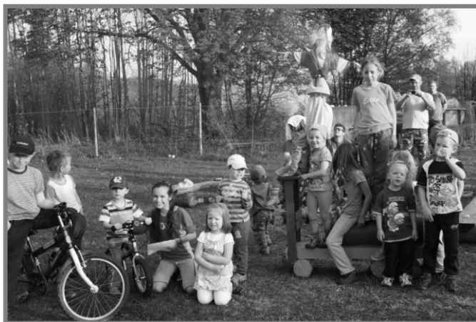
Čarodějnický oheň na Kantoráku, foto M. Klaudivsová