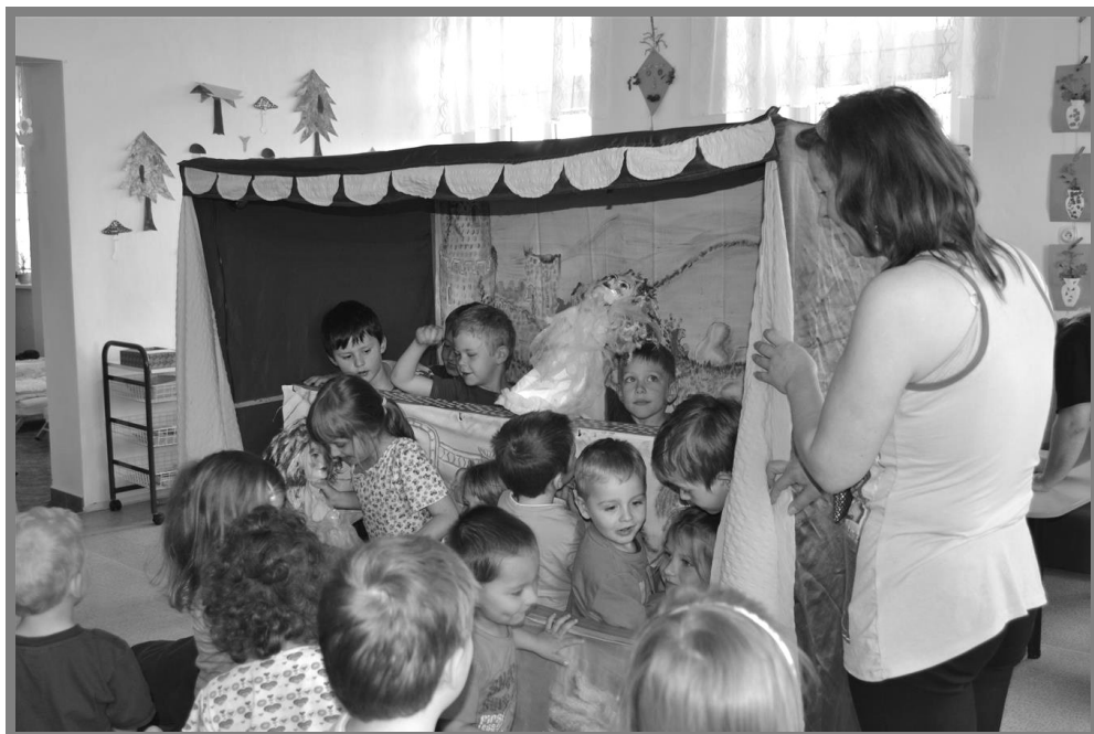
Nahlédnutí do zákulisí po pohádce Vodníček Pepiček , foto M. Strakatá

Maňáskovou pohádku Vodníček Paleček přijelo dětem zahrát divadlo Zvoneček. Po pěkné pohádce děti mohly nahlédnout také do "zákulisí" a prohlédnout si zblízka kulisy a maňásky.