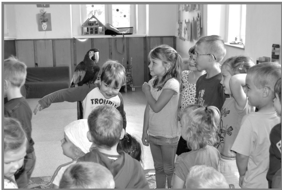
Děti s papouškem, kterého jim půjčil kouzelník

Školní rok zakončíme výletem do Toulcova dvora , kde se děti zúčastní zajímavého programu. Na hvězdičky čeká program Stateček s domácími zvířaty a sluníčka se mohou těšit na program Vrbníček. Děti si mohou v areálu Toulcova dvora prohlédnout hospodářská zvířata, navštíví a prohlédnou si lesní mateřskou školu Lesníček, kde nás uvítá její ředitelka Mgr. Magdalena Kapuciánová.