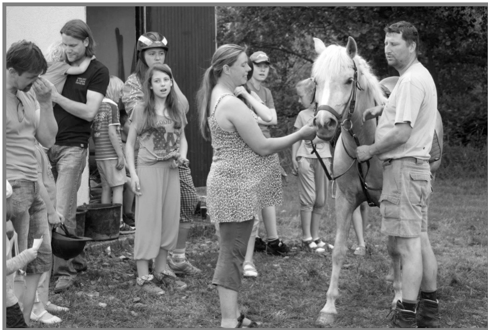
Dětský den 8. 6. 2013 na hřišti Trávníky