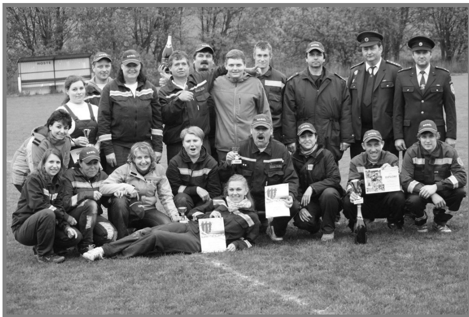
SDH Maršovice na Okrskové soutěži dne 11. 5. 2013