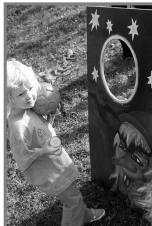
Překážková dráha. Další foto na Life in Maršovice Czech Republic na Facebooku.

Další dětskou akcí byla výroba čarodějnice a následně pak i její pálení při čarodějnickém ohni, při němž si děti měly možnost zasoutěžit o sladké odměny anebo si třeba proběhnout překážkovou dráhou.