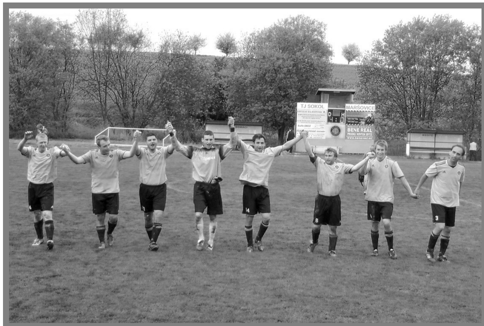
Maršovice - Hořovicko 12. 5. 2013