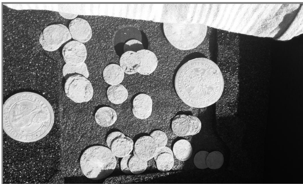
Část maršovického nálezů

* Na poli u Maršovic našli počátkem září detektoráři poklad stříbrných mincí z počátku sedmnáctého století. Depot sedmi sta mincí byl původně uložen v zemi v hliněné nádobě, která však vzala za své plynoucími lety a následně i zemědělskými pracemi. Jednotlivé mince byly po poli roztaženy v délce řádově tří desítek metrů. V současné době jsou mince uloženy v Muzeu Podblanicka ve Vlašimi. Odtud by se měly koncem roku přesunout do Národního muzea v Praze k odborné analýze.