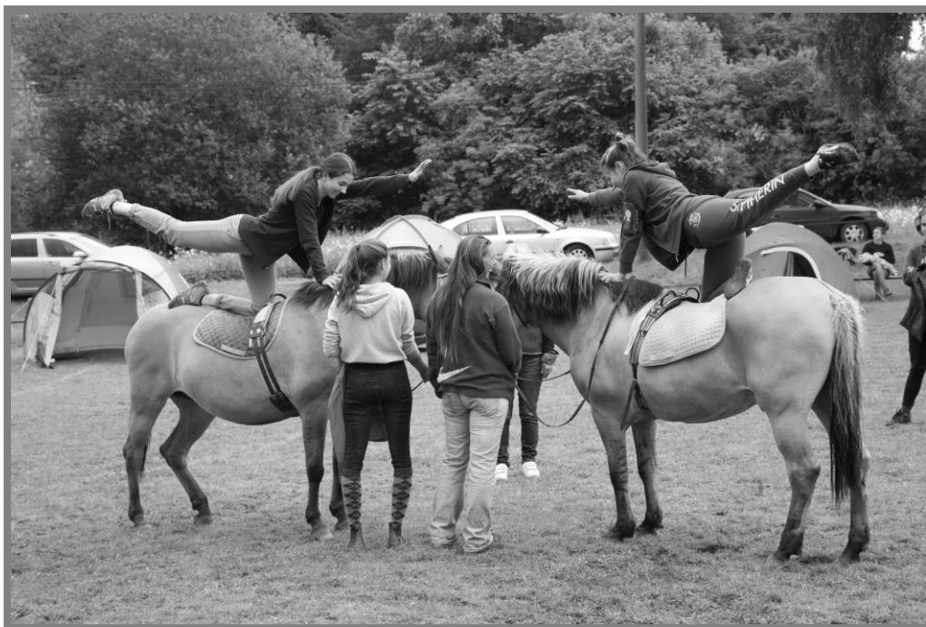
Hudební večer Hájek 2020 na parketu ve Mstěticích