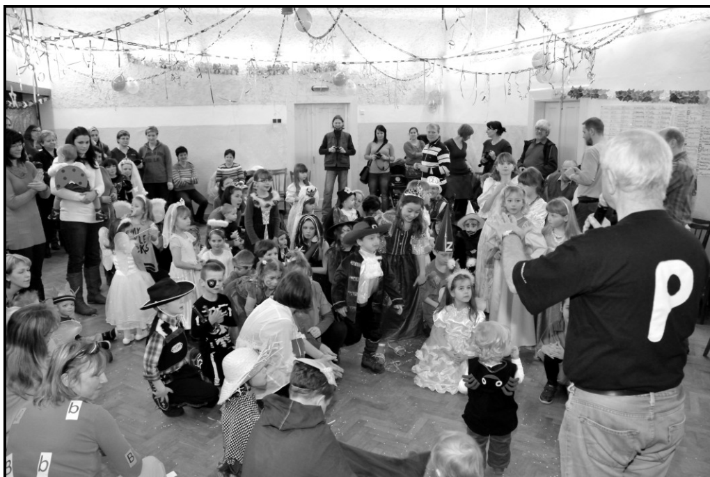
Karnevalový rej v Maršovicích dne 26. 2. 2012