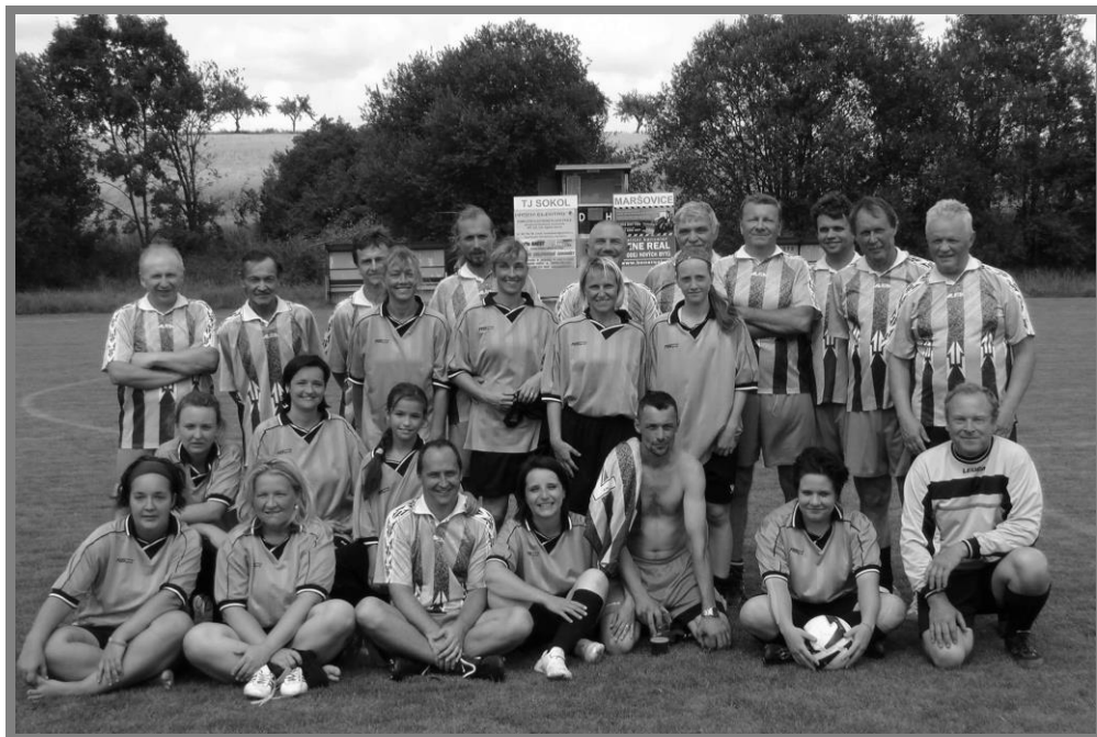
Memoriál Stanislava Fürsta

- V rámci už letní přípravy pak na kvalitním trávníku proběhl další memoriál Stanislava Fürsta. V dopoledních utkáních jsme nejprve podlehlí Týnci a Olbramovice porazili.