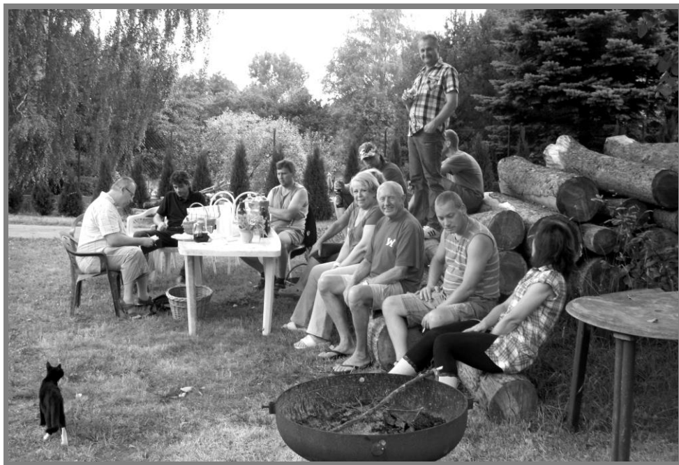
Setkání IV v Zahrádce

některých obecních cest se vysadila stromořadí. Z podnětu městyse se čistil Bukovský potok ve Zderadicích a Janovický potok v Libči a Zahrádce, zahájila se obnova břehových porostů na potoku pod Zahrádkou. Odbahnula se požární nádrž v Maršovcích. Zlikvidovala se černá skládka nad Zaječím, zkrásněla i část úvozové cesty v Maršovcích. Dokončili jsme Změnu č. 4. Územního plánu městyse Maršovice, pořídili jsme Územní studii pro Lokalitu Jih – Maršovice a zahájila se tvorba nového územního plánu. Městys získal stavební povolení pro kanalizaci a ČOV v Maršovcích. V současné době se zpracovává prováděcí dokumentace k této stavební akci. Vyměnily se části rozvodného vodovodního řadu maršovického vodovodu před hospodou a na městečku. Propojily se jednotlivé větve vodovodu od Novákových k bývalé samoobsluze. Ve Zderadicích se osadil na přírodní řad vodoměr. Byl zde instalován automatický dávkovač chloru. Vznikla tradice červencových Setkání se spoluobčany jednotlivých vesnic. Proběhla vzpomínková akce Ohlédnutí, připomínající vystěhování během druhé světové války, završená návštěvou pamětníků v Senátu a vydání Almanachu. Úspěšná byla účast městyse v soutěži Vesnice roku Středočeského kraje 2014. Podali jsme dvanáct žádostí o různé granty. Pět úspěšných přineslo do obecního rozpočtu cca 1 800 000 Kč.