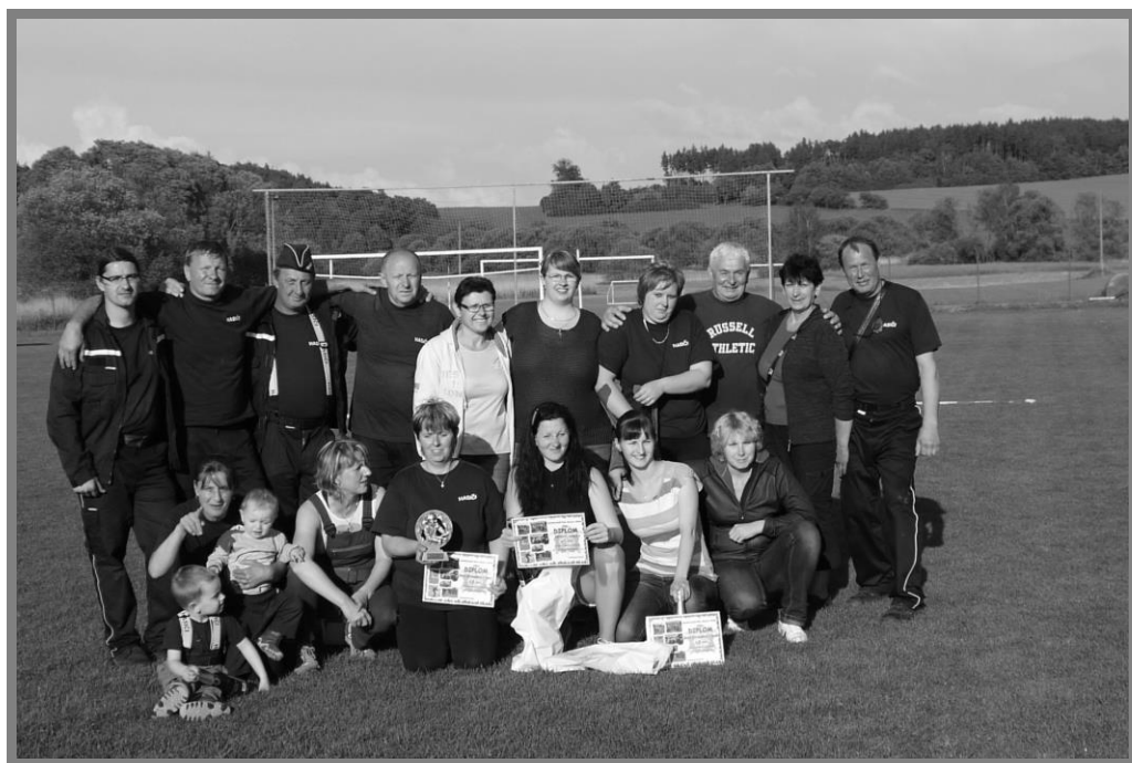
Okrsková soutěž v požárním sportu v Maršovicích