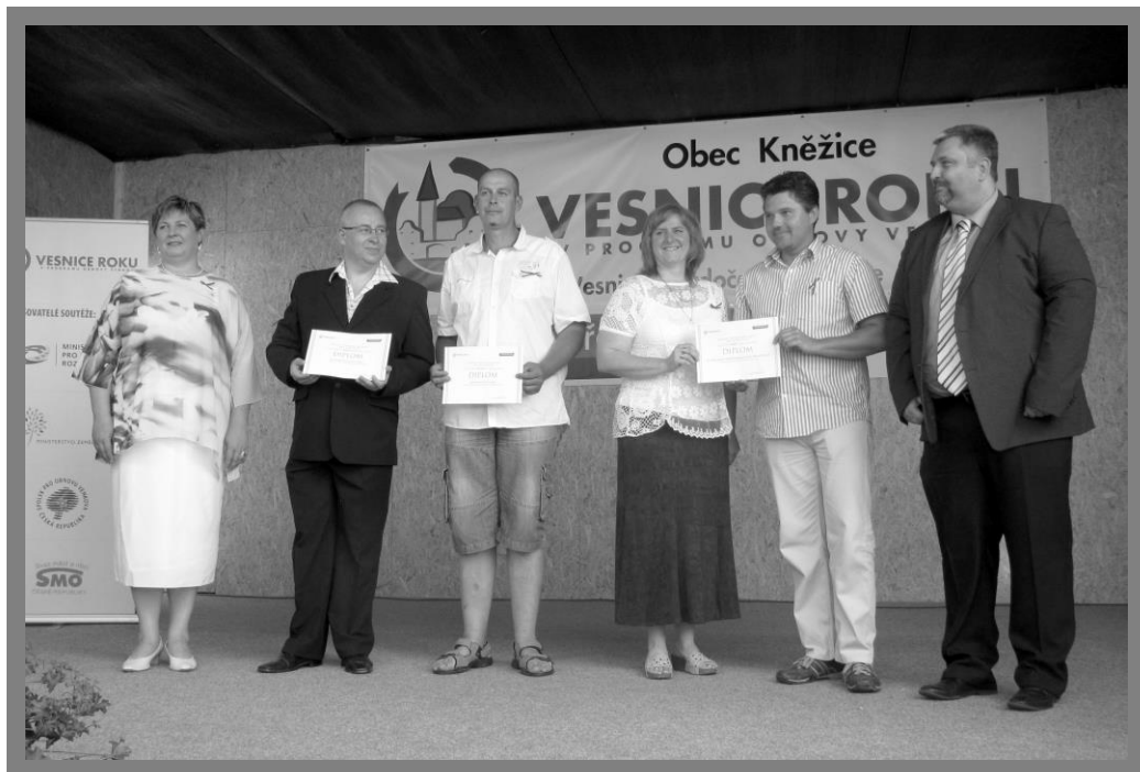
Vyhlášení výsledků soutěže Vesnice roku Středočeského kraje 2014 v Kněžicích