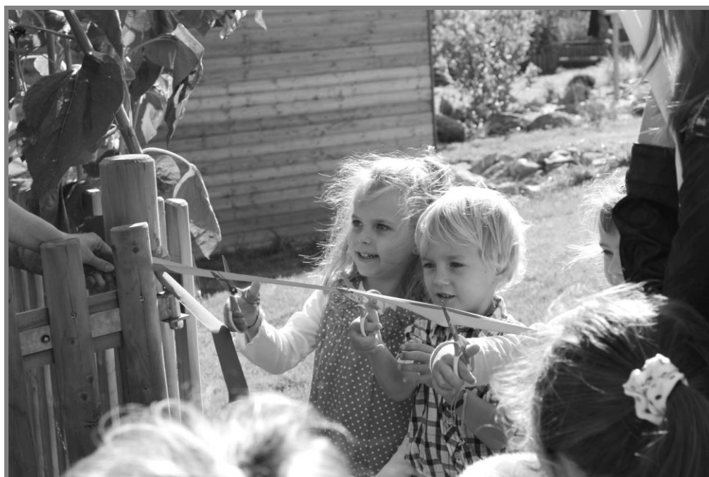
Další fotografie ze slavnostního otevření zahrady najdete na stránkách městyse Maršovice