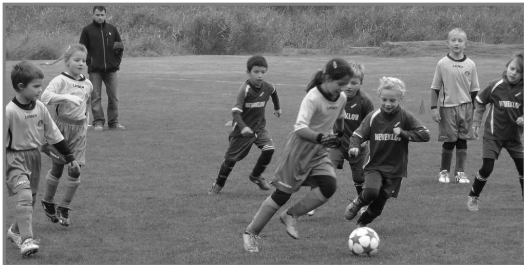
Přípravek turnaj 18. 10. 2015

reprezentují v mládežnických kategoriích mladší žáci a mladší přípravek. Oba tyto týmy jsou po odehraném podzimu uprostřed tabulek svých soutěží, ale to není v těchto kategoriích to nejdůležitější, protože tady je hlavní zápal a chuť do fotbalu, která našim mládežníkům rozhodně nechybí, a to nám dává velkou naději, že se o kopanou v Maršovicích nemusíme na mnoho následujících let obávat.