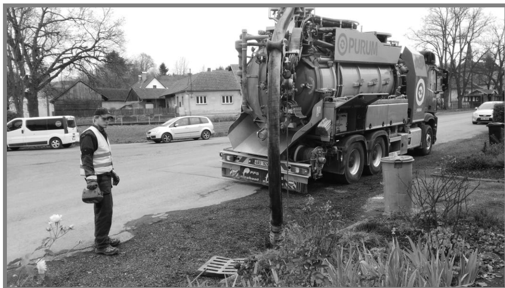
Čištění dešťové kanalizace v Maršovicích

Od ledna se vybírají na Úřadu městyse Maršovice místní poplatky za svoz komunálního odpadu a poplatky za psy . Po zaplacení poplatku vám bude vydána známka na popelnici. V průběhu ledna 2016 však bude svozová firma Marius Pedersen vyvážet popelnice ještě na základě starých známek z roku 2015.