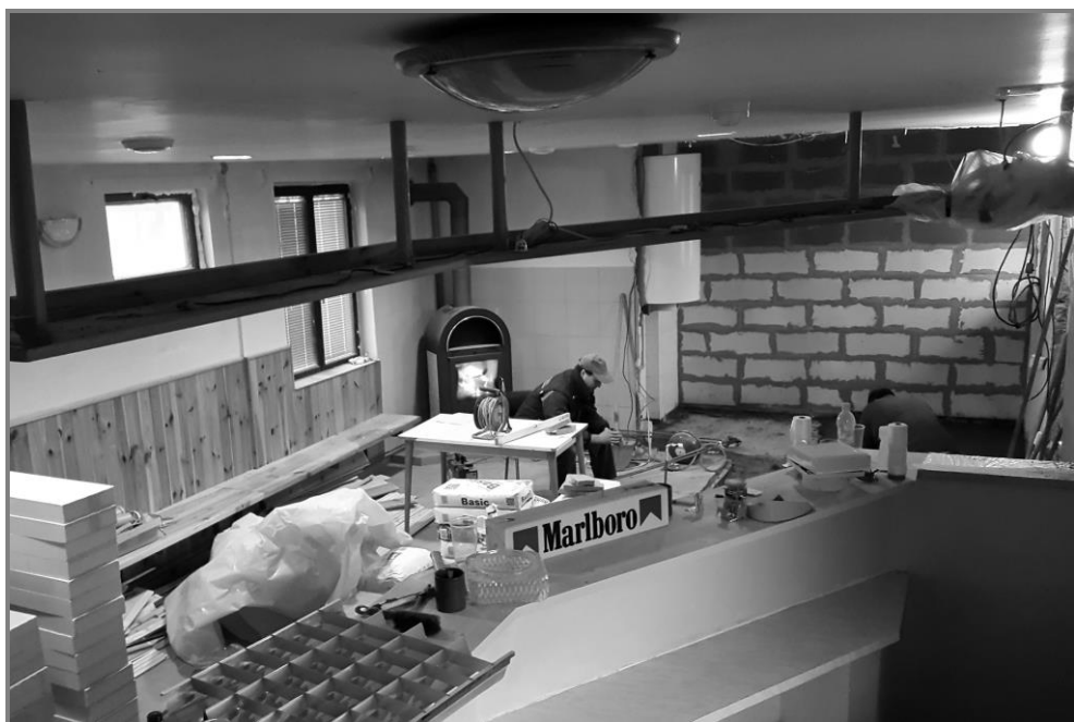
Oprava starých kabin