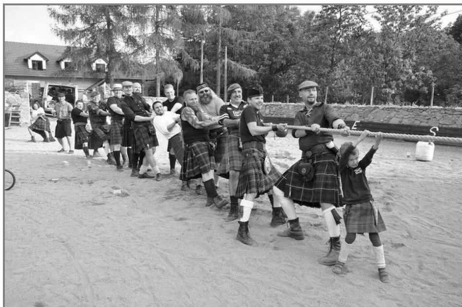
Horalské hry ve Zderadicích konané dne 3. 10. 2015