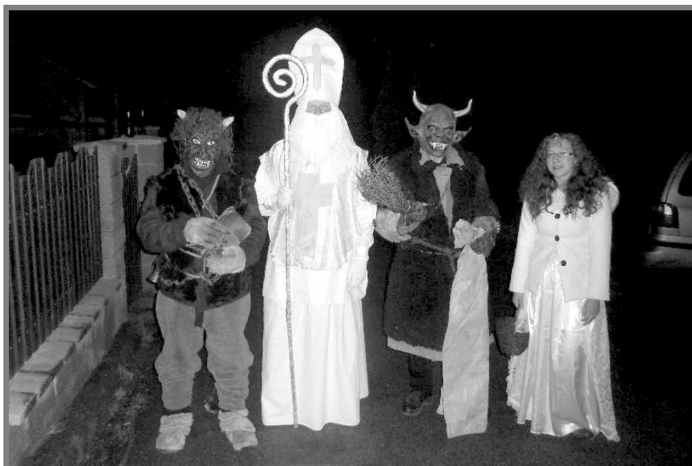
Letošní Mikulášská parta ve Zderadicích

Právě probíhá adventní čas. Na jeho počátku jsme si připomínali svatého Mikuláše, který je u nás spjatý s tradicí čertů, anděla a Mikuláše. A tady začíná malé ohlédnutí za rokem 2015. Pro nejmladší obyvatele Zderadic a blízkého okolí jsme upořádali mikulášskou nadílku.