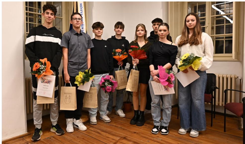
Slavnost patnáctiletých, která proběhla 21. 11. 2025