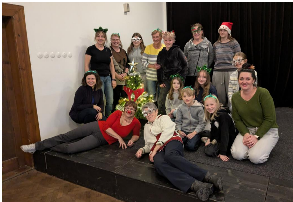
Realizační tým letošních Vánočních dílniček v Maršovicích