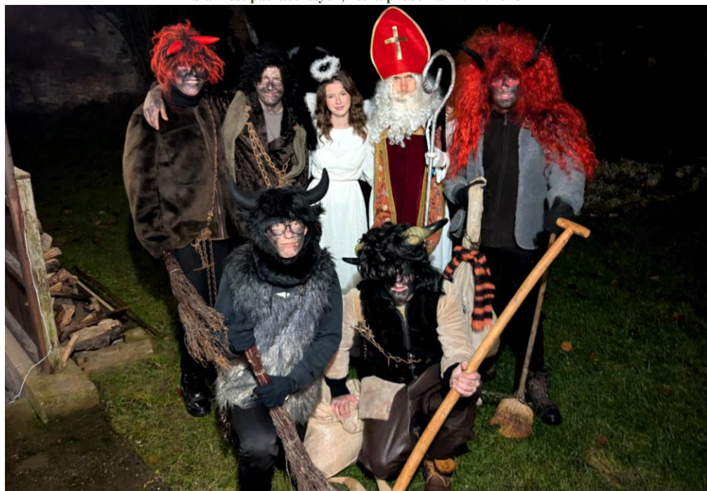
Svatý Mikuláš a jeho doprovod v Maršovcích

Maršovická Louka - registrováno OKÚ Benešov, Evidenční číslo MK ČR E 10744