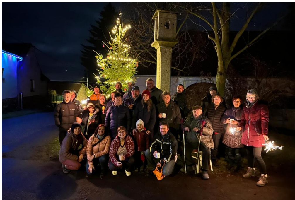
Rozsvícení stromečku v Řehovicích