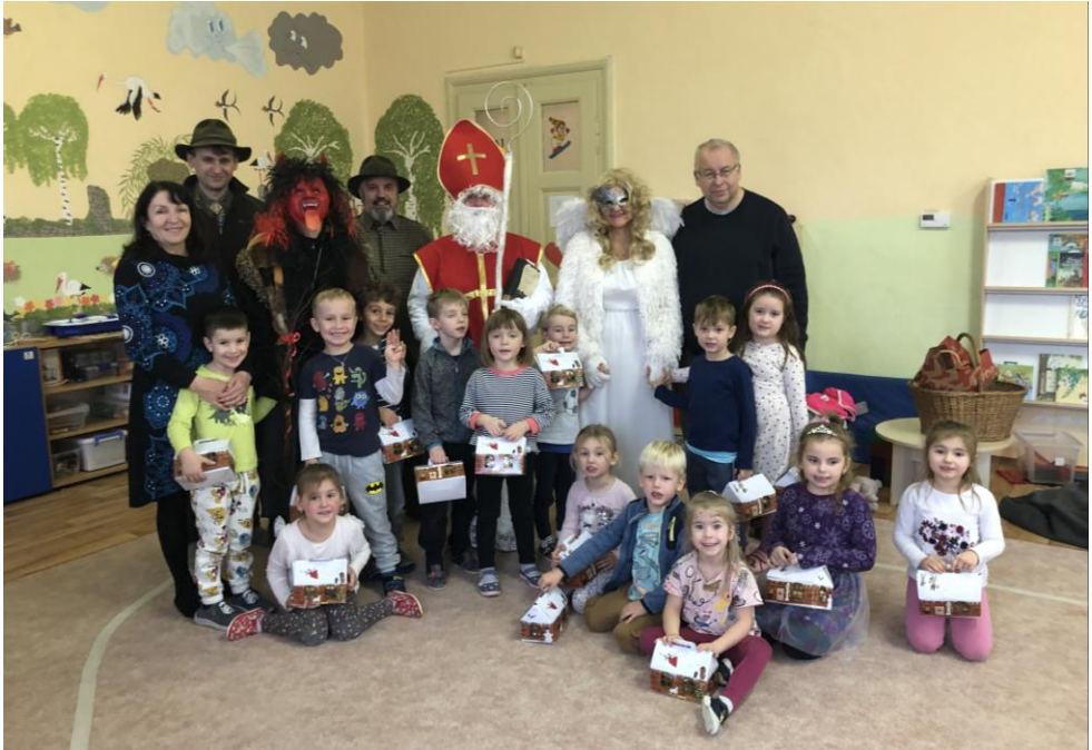
Svatý Mikuláš a jeho doprovod v Mateřské školce v Maršovicích