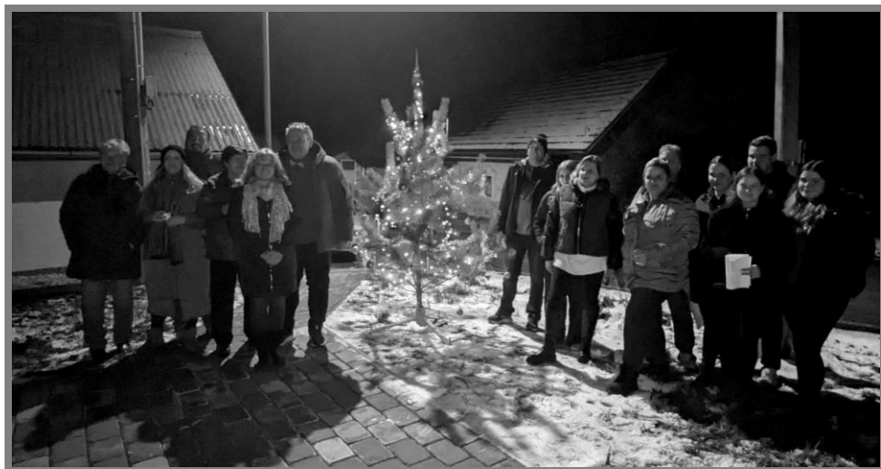
Rozsvícení stromečku ve Dlouhé Lhotě