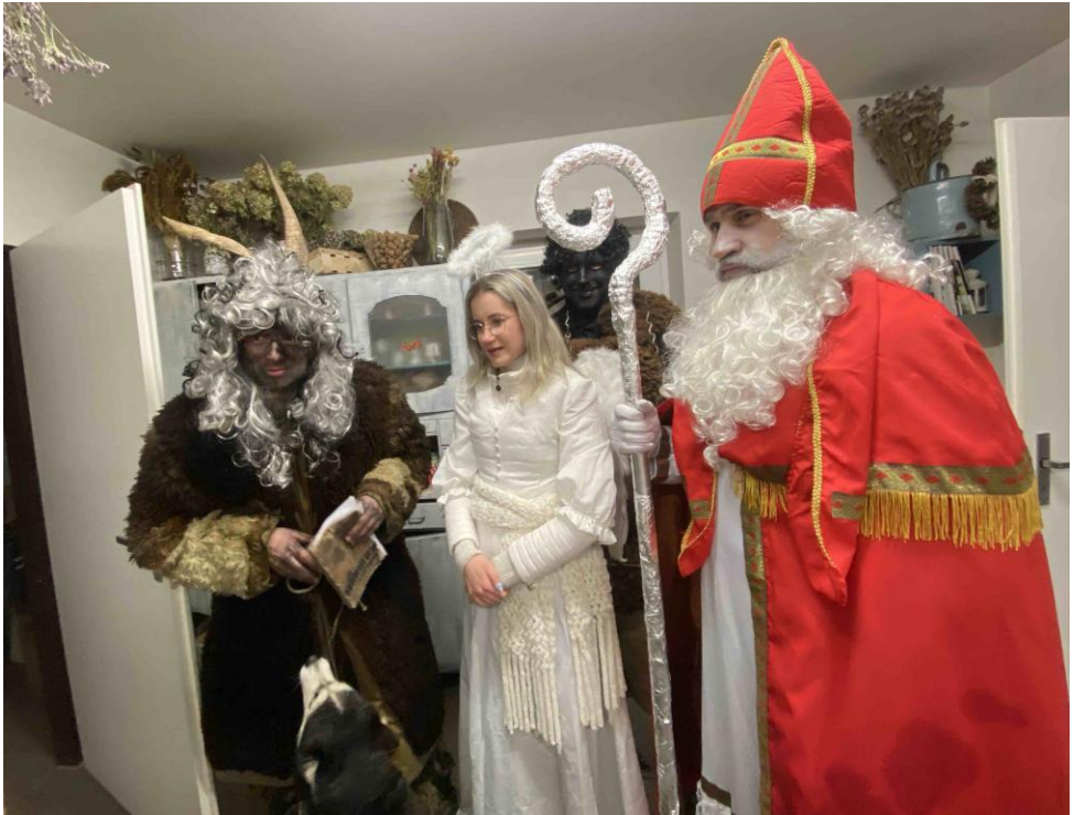
Mikulášská obchůzka ve Zderadicích