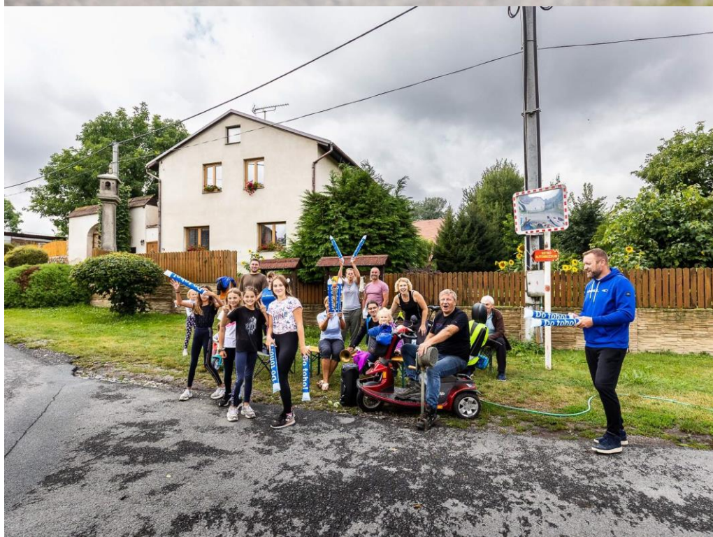
Cyklistický závod Železný dědek, 21. 8. 2022