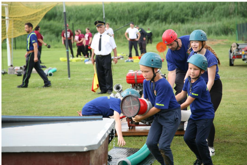
Okresková soutěž v požárním sportu 25. 6. 2022