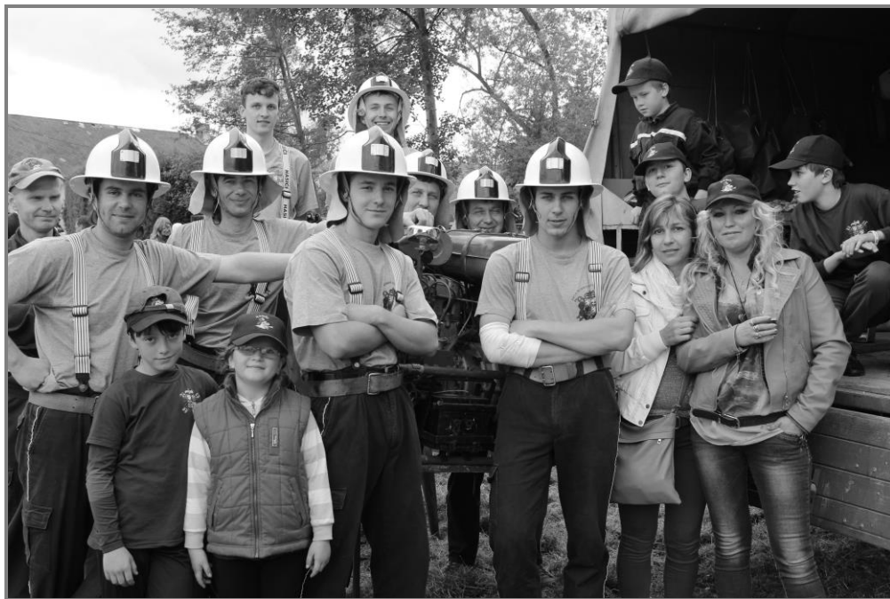
Okrsková soutěž v požárním sportu, květen 2015

V současné době je otázka prostorů pro hasičskou činnost opět na pořadu dne. Budova č.p. 6 sice hasičům slouží dále, dokonce má SDH v Zahrádce v této budově statutární sídlo, ale svým využitím je to spíše sklad. Pokud se mají hasiči sejít a poschůzovat, musí využít volné kapacity restaurací v okolí nebo schůzovat venku pod širým nebem či pod lípou jako v případech setkání se zastupiteli a se starostou městyse Maršovice.