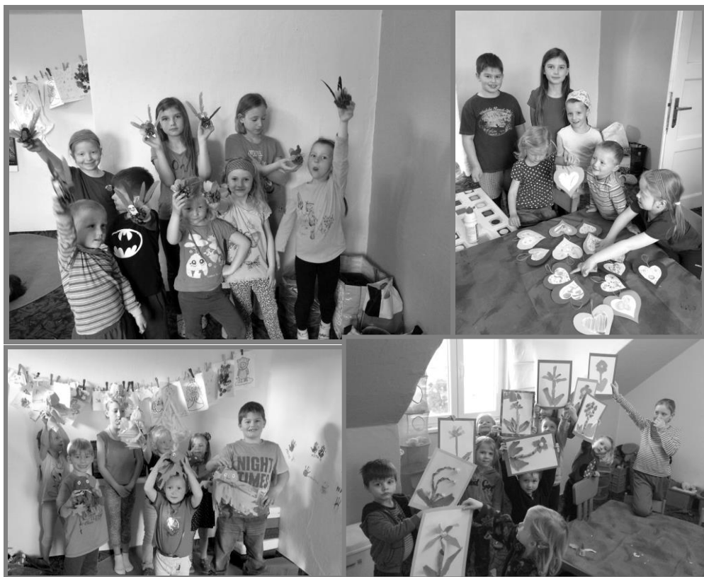
Kroužek pro šikovné dětské ručičky