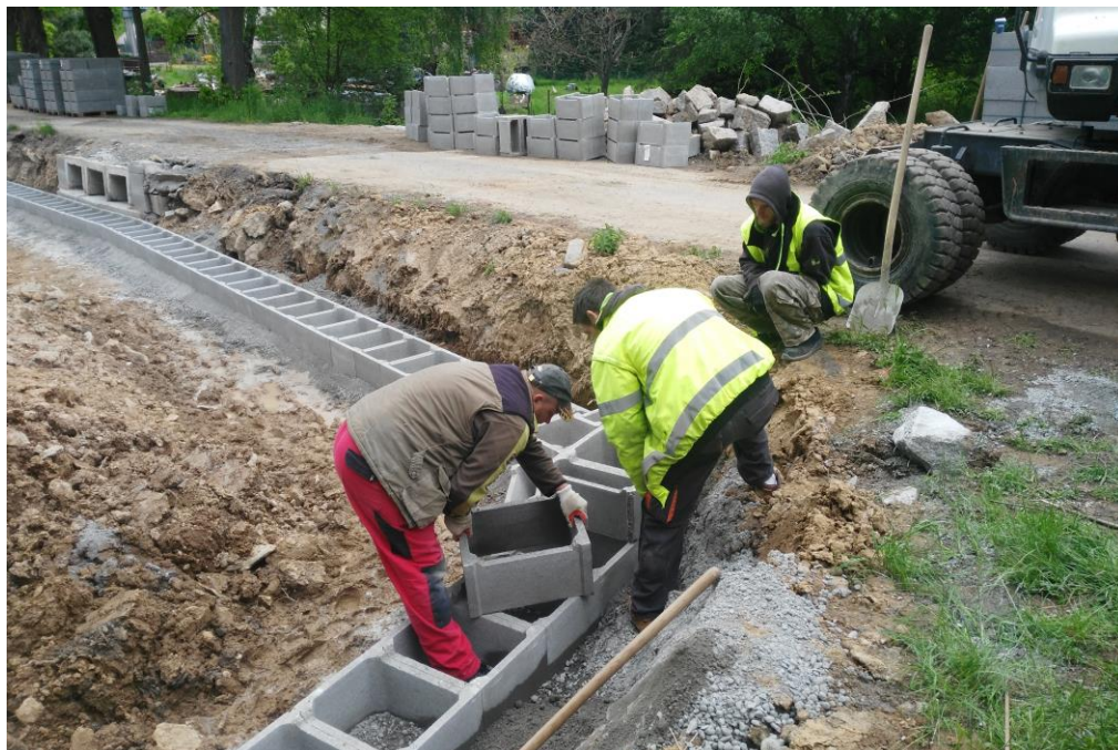
Z opravy mstětického návesního rybníka