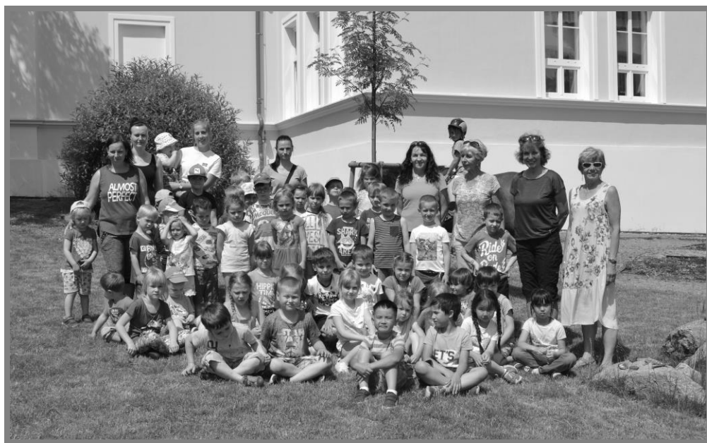
Společná fotografie z návštěvy pražské školky Mezi domy