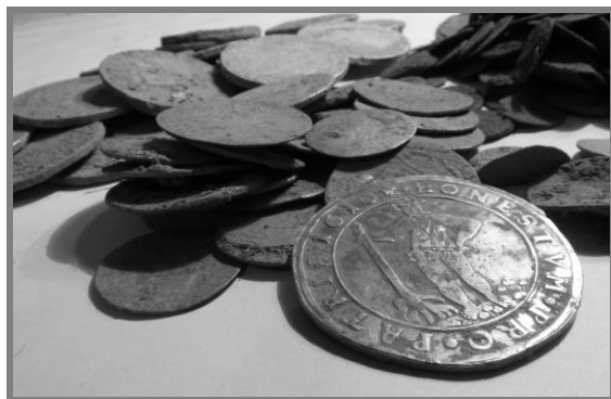
Nálezový stav mincí - v popředí tolar z Dolního Saska