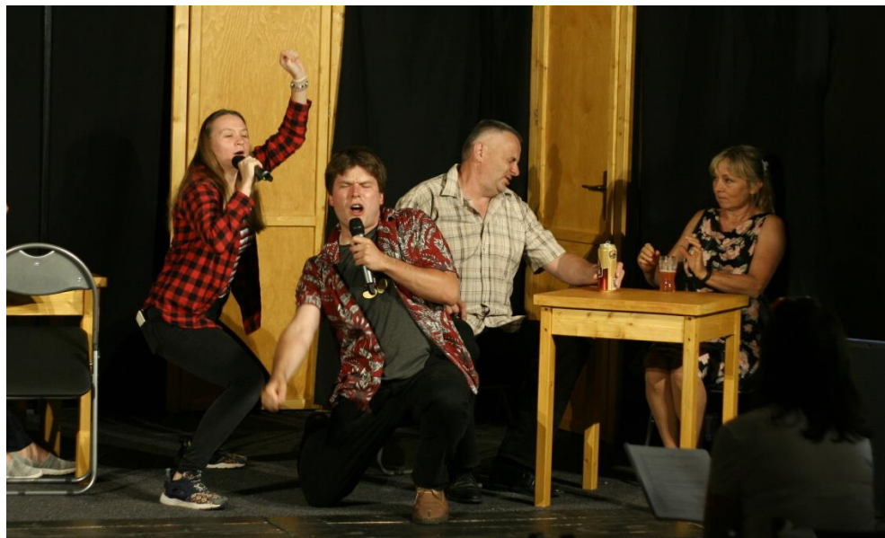
Nová inscenace Zornice Maršovice – Ztracená v čase