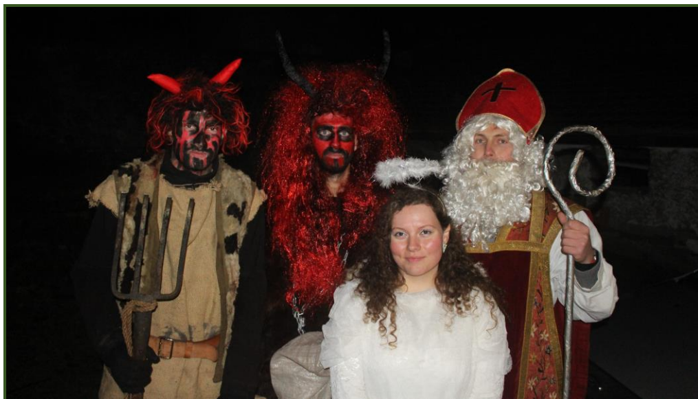
Svatý Mikuláš a jeho doprovod v Maršovicích