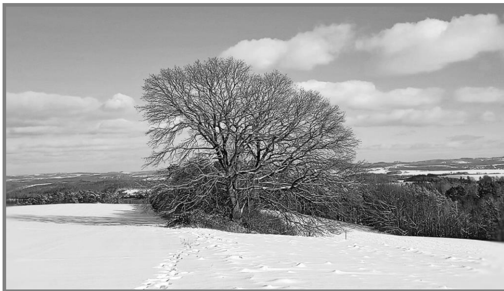
Fotografie starého dubu nad Zaječím z loňské zimy. Strom se bohužel nedávno rozlomil v půli

(kontakty: kosanova@email.cz nebo například Facebook Ateliér Zaječí)