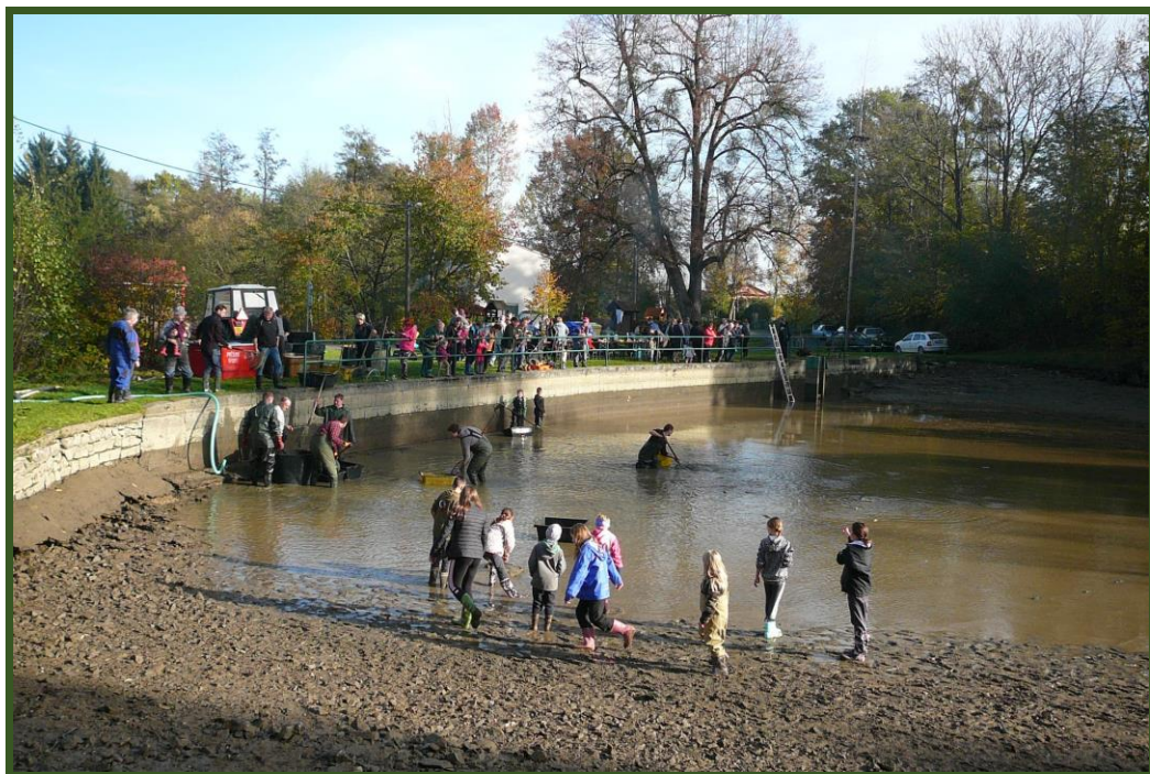
Výlov rybníka ve Strnadčích