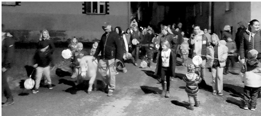
Svatomartinský lampionový průvod