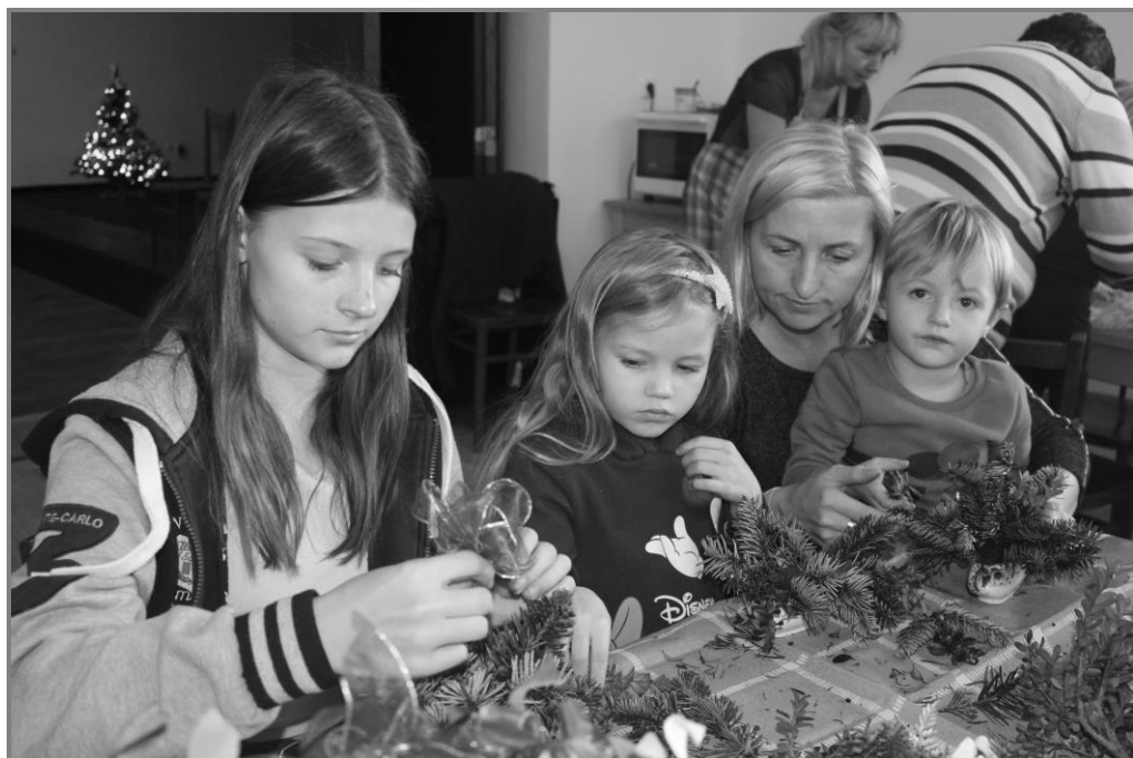
Vánoční dílničky v Maršovicích