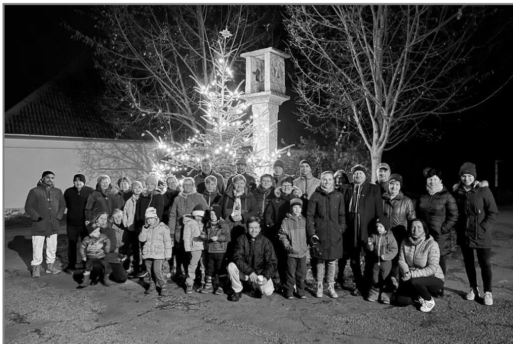
Řehovické předvánoční ladění