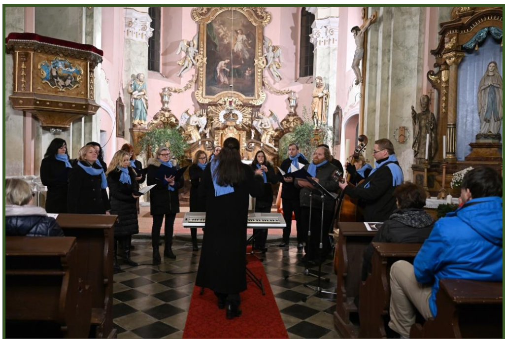
Adventní koncert 9. 12. 2022 pěveckého sboru Dech