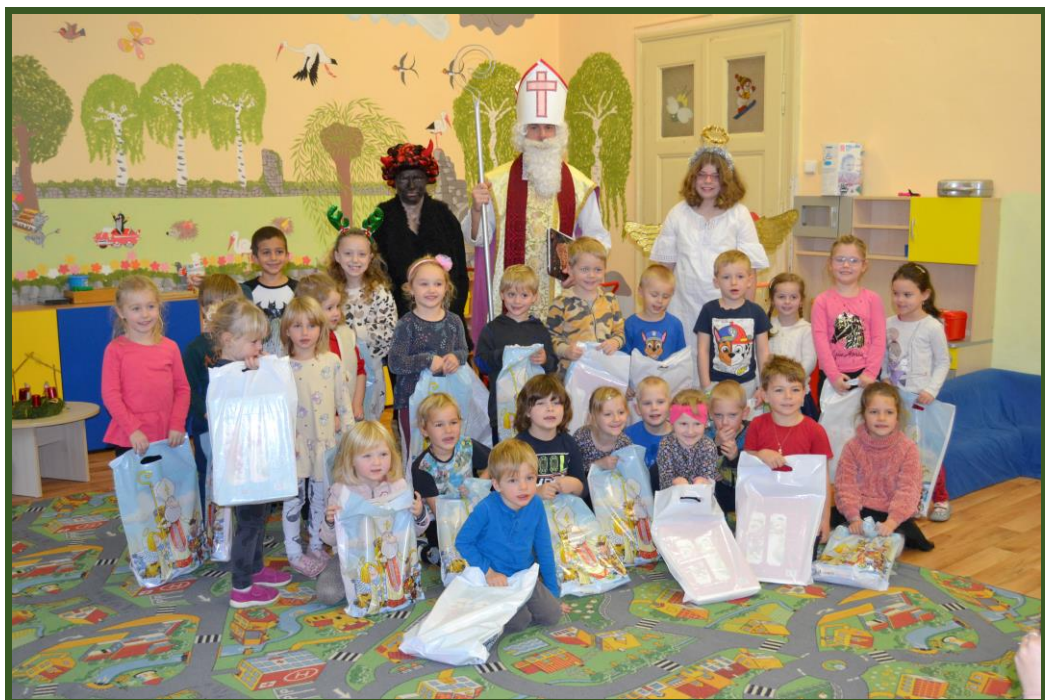
Svatý Mikuláš s čertem a andělem v MŠ Maršovice