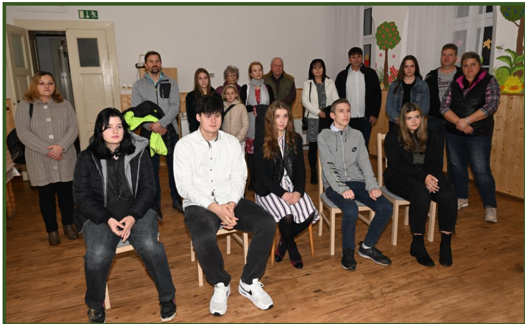
Slavnost patnáctiletých proběhla 5. 10. 2022